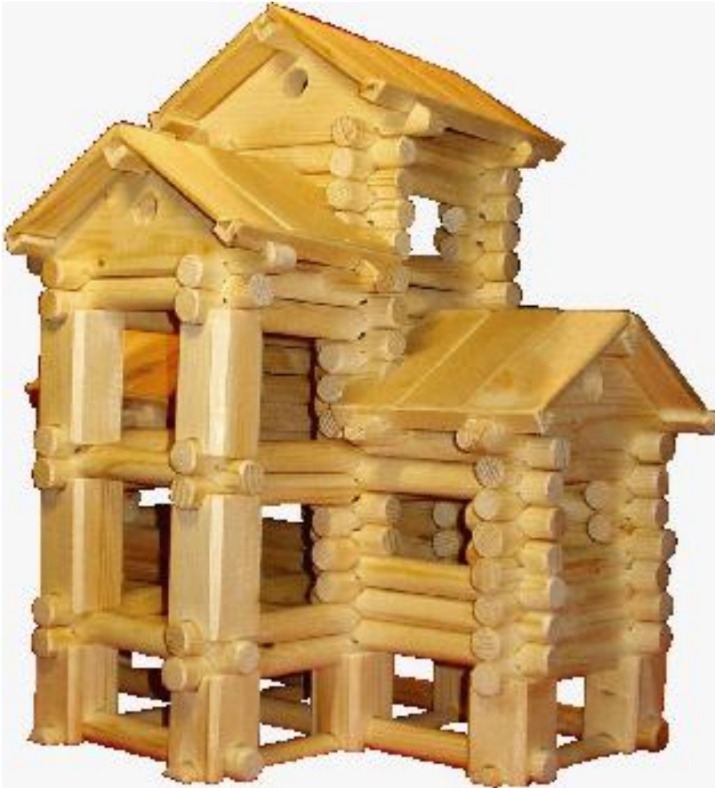
T-Grundriss, Block- und Steherbau